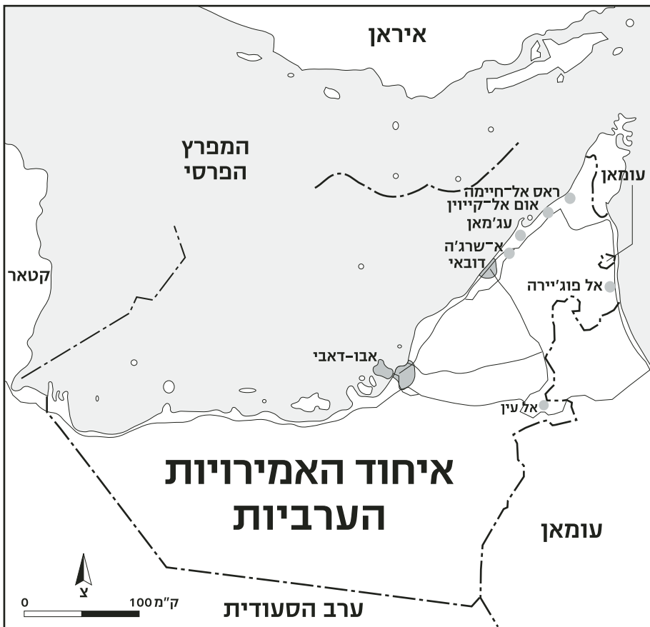
מפת איחוד האמירויות

וישנו עוד דבר שצריך להביא בחשבון: את ההיגיון. בעיצומה של הטלטלה הערבית דרשו ההמונים יותר דמוקרטיה. בשום מקום לא יצאו המונים לרחובות בדרישה להמליך עליהם מלכים. במילים אחרות: הטלטלה בעולם הערבי מערערת את הטענה שהמלוכה היא צורת השלטון הלגיטימית במרחב. לכן גם לא ניתן לקבוע בפסקנות שתפיסות דתיות או מסורות שבטיות מעניקות לגיטימציה לשלטונו של מונרך. אולם ללא יכולת של ממש למדוד את הלגיטימציה של משטר ניתן רק לטעון שהמשכיותו היא העדות ללגיטימציה שלו. אבל חוקרים רבים הרי טוענים שהלגיטימציה היא הסיבה להמשכיותו של המונרכיות. והנה לכם טאוטולוגיה במיטבה.