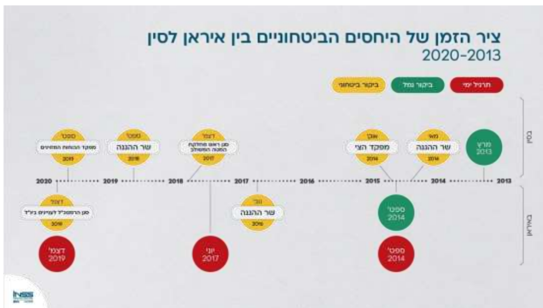
תרשים 2: ציר זמן צבאי וביטחוני סין-איראן 2020-2013