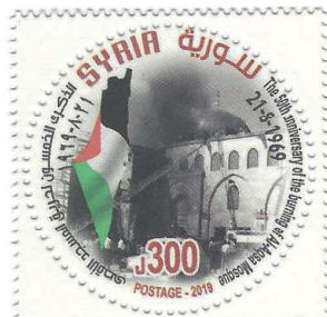
הבול הסורי לציון יובל לשריפה במסגד אל-אקצא

פוליטית, אלא נובעת מהקיפאון השורר בשנים האחרונות בפעילות הדואר הכווייתי, שכמעט שאינו מנפיק בולים. עוד נעדרות מרשימת המנפיקות הן סוריה וערב הסעודית. סוריה הושעתה מהליגה הערבית בנובמבר 2011 על רקע הדיכוי האלים של מחאות "האביב הערבי" והורחקה מכל מוסדותיה. במקום הבול המשותף, וכדי להדגיש את מחויבותה המתמשכת לעניין הפלסטיני ולירושלים, הנפיקה סוריה באוגוסט 2019 בול וגיליון מזכרת לציון יובל לשריפה במסגד אל-אקצא. התמהמהותה של ערב הסעודית עם ההנפקה נובעת ככל הנראה מתמיכתה בנושא טראמפ ובמדיניותו בנושא הפלסטיני, כפי שהשתקף בבול עליו הופיעו טראמפ והמלך סלמאן מנובמבר 2017. עם זאת, קיים עדיין סיכוי שערב הסעודית תצטרף בהמשך לשיירת המנפיקות.