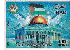
שתי מהדורות הבול העיראקי בטונים שונים