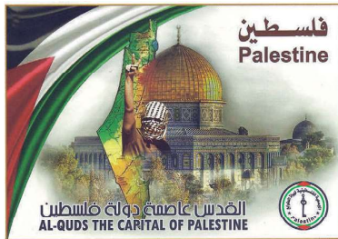
תוויות עם עיצוביו של ראזי מטעם אגודה פלסטינית לחובבי בולים