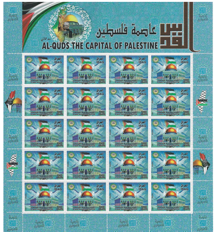
גיליון הבול העיראקי ובשוליו המוטיבים של ראזי