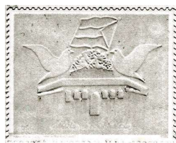
חריטה בגב הבול הירדני