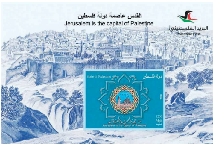
ההנפקה הפלסטינית המוחרמת