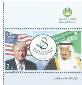
בול סעודי לציון ביקור הנשיא טראמפ בממלכה

וגם במחירים אלה קשה להשיגו. ההנפקה הירדנית השנייה נמכרת אף היא בעשרות דולרים, מחיר גבוה באופן ניכר מערכה הנומינלי. שאר הבולים מוצעים לרוב בדולרים בודדים. מאז ומתמיד היה ביקוש גדול בארצות ערב לבולים הקשורים בפלסטין, אך המחירים הגבוהים של בולי עומאן וירדן נובעים בעיקר מההיצע המוגבל שלהם. כך למשל, בעוד תוניסיה הנפיקה 600,000 בולים, עומאן וירדן נוהגות להסתפק בכמויות קטנות יותר והדפיסו הפעם 5,400 ו-4,000 יחידות בהתאמה.