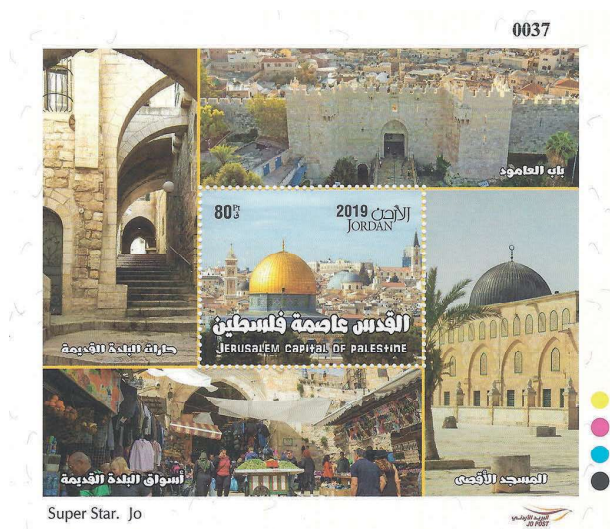
Super Star. Jo