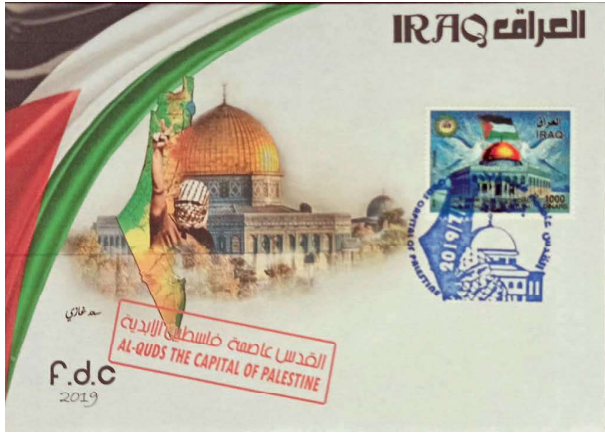
מעטפת היום הראשון העיראקית בעיצוב ראזי