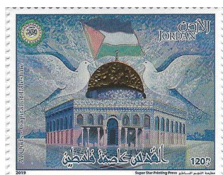
הבול הירדני עם העישוב המאוחד