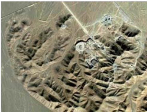
"האתר שנחשף בקום ראוי שישים תמרור אזהרה". האתר בקום

עם זאת, ראש אמ"ן ציין כי הנשיא הסורי "מארח מדי שבוע שרי חוץ מכובדים, מלכים וסנאטורים, הממתינים להודות לו על אי התערבותו בבחירות בלבנון, אך מי שמכיר את המודיעין יודע כי אסד התערב בבחירות בכסף ובאיומים והפך את תוצאות הבחירות על פניהם. בעוד התור לדלתו מתארך, בדלתו האחורית חומקים חלאד משעל ונסראללה ואנשי ביטחון אירניים שסיימו לסכם רכש של אמצעי לחימה".