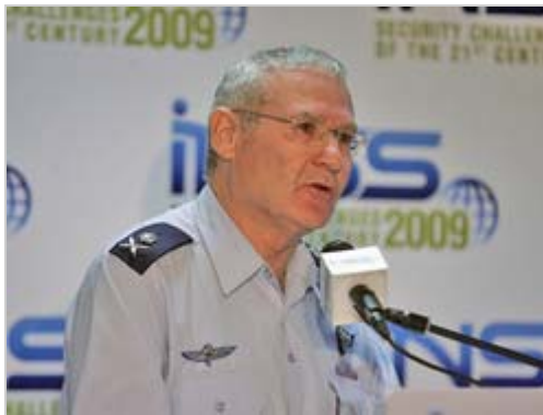
"חשוב לשוב למו"מ עם אירן וזאת לשם רתימת כל שש המעצמות לעגלת הסנקציות". אלוף ידלין (אורי לנץ)

תגיות: סוריה, אירן, גרעין, תמיכה בטרור, תהליך השלום