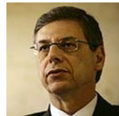
איילון. "להפריד את היחסים"

דמשק מתעקשת על תיווכה של טורקיה, "משום שהיא רוצה לחדש את המשא ומתן עם ישראל מהנקודה אליה הגיעו השיחות עם אהוד אולמרט, ולא לחזור לנקודת ההתחלה". העיתון "א-שרק אל אווסט" דיווח כי לפי דמשק, אנקרה היא זו אשר "מחזיקה בהבטחות ובהתחייבויות הישראליות ולכן אין זה האינטרס שלה היום שיבוא מתווך חדש".