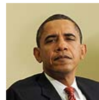
אובמה. "אין אסטרטגיה מגובשת"