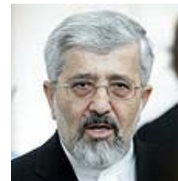
הנציג האיראני לשיחות, עלי אסגר סולטניה. "נושא ונותן מתוכם"