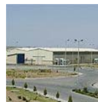
המתקן בנתנז. "נוספות עוד ועוד צנטריפוגות"