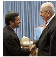
הנשיא אחמדינג'אד עם יו"ר סבא"א, מוחמד אל-בראדעי, בווינה

ד"ר לנדאו גם מציעה פתרון לבעיה זו: "לדעתי הפורום הנכון לניהול השיחות הוא פורום דו-צדדי בין ארה"ב לאיראן. הבעיה היא שאובמה נסוג מזה. ארה"ב צריכה לגבש אסטרטגיה מגובשת מול איראן, ולחשוב על הסדר שיסתכל מעבר לגרעין.